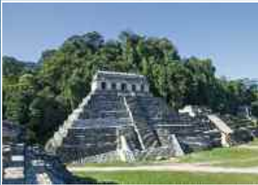
Bij de Maya's en Inca's