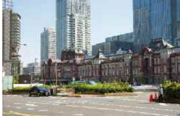
Tokio Centraal Station

kong. Er is zoveel te beleven en te zien dat één dag Hongkong eigenlijk niet volstaat. Daarom ligt de Voyager hier net als in Beijing, Shanghai, Kyoto en Tokio twee dagen voor anker zodat u de tijd heeft om Hongkong te ontdekken. Shoppen in luxe winkelcentra, slenteren over lokale marktjes, wandelen in de rust van The Peak met prachtige vergezichten over de drukke stad, een bezoek aan een van de stranden, in Hongkong kan alles. Wie een flinke klim aandurft, kan een bezoek brengen aan de Tian Tan Boeddha op Lantau. Het is de grootste zittende bronzen Boeddha in de open lucht ter wereld en staat nabij het Po Lin klooster, een belangrijk boeddhistisch centrum en een populaire toeristische attractie. En is de skyline van Hongkong overdag al indrukwekkend, tijdens de enorme lichtshow die 's avonds wordt gehouden is het fenomenaal.