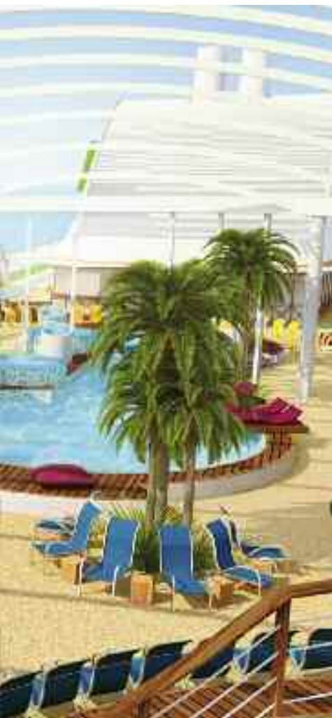
AIDA Beach Cub

terug te vinden. Een wandeling door de straten geeft een goede indruk van de sfeer en het dagelijks leven.