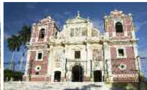
Calvario Kerk, León