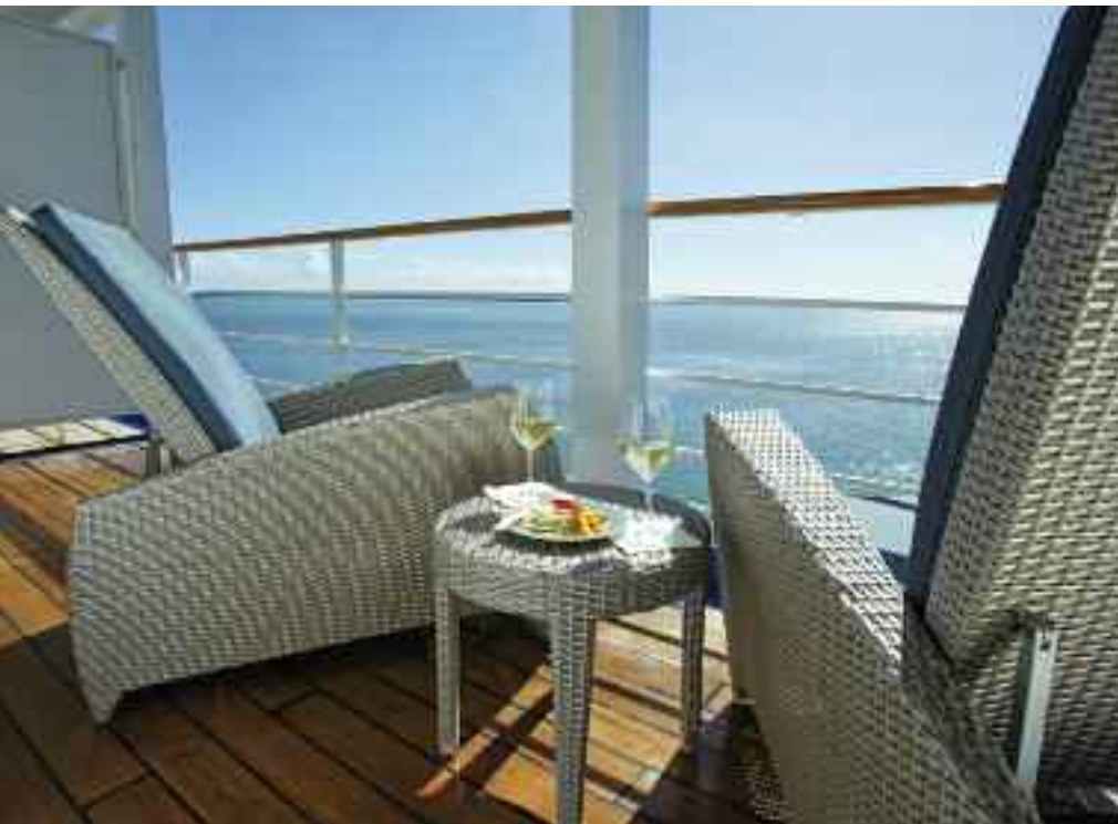
Interieur Seven Seas Mariner