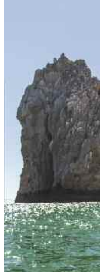
El Arco, Mexico

ruïnes waren 350 jaar lang zoek, maar in 1967 zijn ze herontdekt en opgegraven. Zeker de moeite waard om te bezoeken. Net als het huidige León. De stad is tegenwoordig de belangrijkste universiteitsstad van Nicaragua. León bestaat uit vele wijken met elk hun eigen katholieke kerkje bomvol religieuze kunstwerken. De Calvario Kerk, de Laborío Kerk en La Recolectión worden tot de mooiste gerekend.