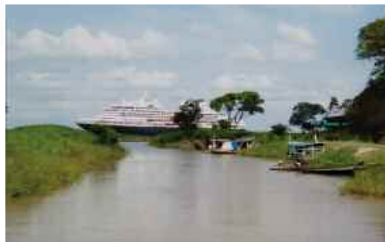
Het ms Prinsendam