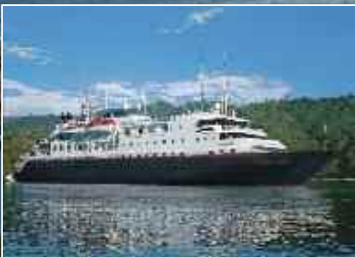
Op expeditie met Discoverer