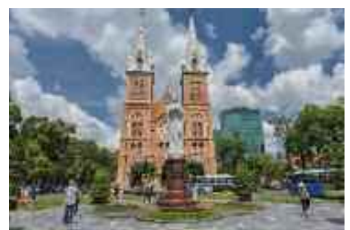
Ho Chi Minhstad