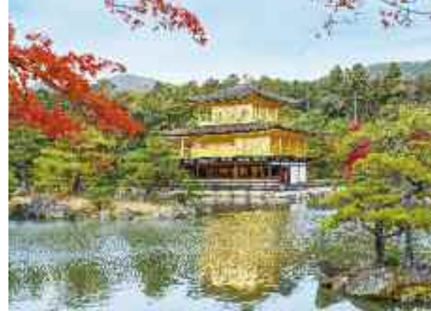
Gouden Paviljoen Kyoto

maar omdat ze in China, Zuid-Korea, Japan en Taiwan liggen. Neem het overweldigende China met hoofdstad Beijing, dat met zijn 15 miljoen inwoners bijna net zoveel inwoners heeft als heel Nederland. Een van de meest indrukwekkende plekken is de Verboden Stad. Vanuit hier bestuurden verschillende keizers jarenlang hun rijk. De Verboden Stad is een van China's grootste toeristentrekkers. Bij binnenkomst is de weidsheid van het plein overweldigend. De imposante gebouwen zijn kleurrijk en dankzij de achttien jaar durende renovatie zien ze er weer uit als voorheen. Door de grootte van het complex is het zelfs mogelijk om, ondanks de drukte, u even helemaal alleen te wanen. Wat u ook op zal vallen is dat u de gebouwen van de stad niet in mag. De ruimtes zijn daarvoor helaas te klein. Daarom hebben de Chinese autoriteiten besloten